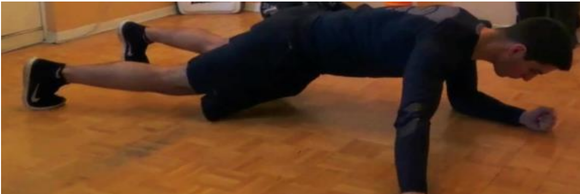
Plank Arm Raises