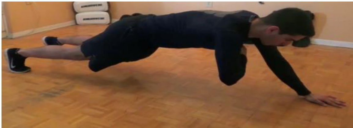
Plank With Side Touch