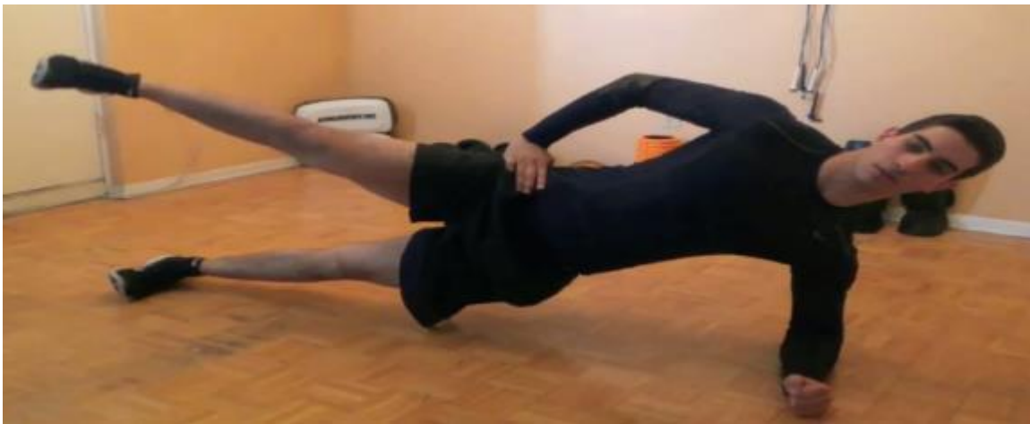
Close Grip Push Ups